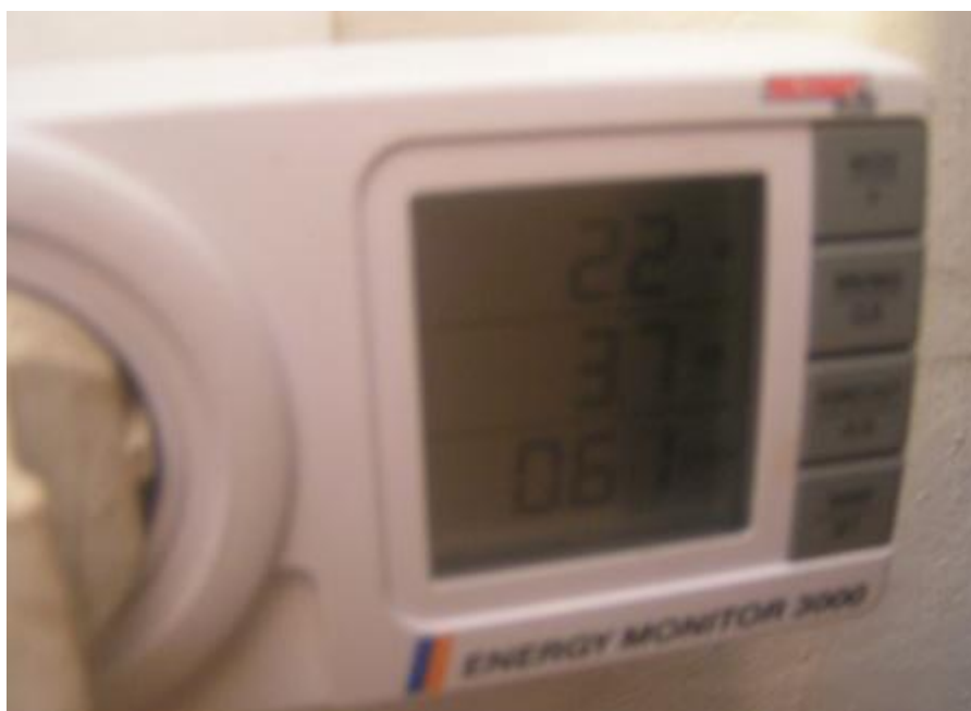
Figure 3 lecteur cd / 22 watts/ 37VA / cos 0.61