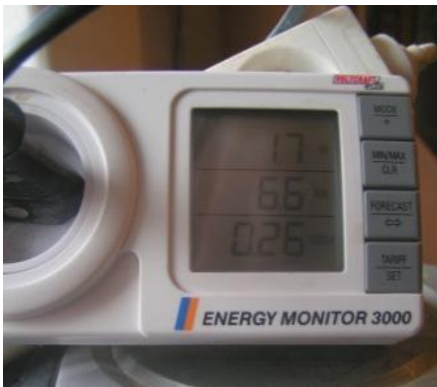
Figure 2 : Radio cd portable 17 Watts / 66 VA / cos 0.26

Cet appareil de mesures est facile à utiliser, peu coûteux (70 €), et permet mieux que le compteur électronique, de repérer les consommations énergétiques.