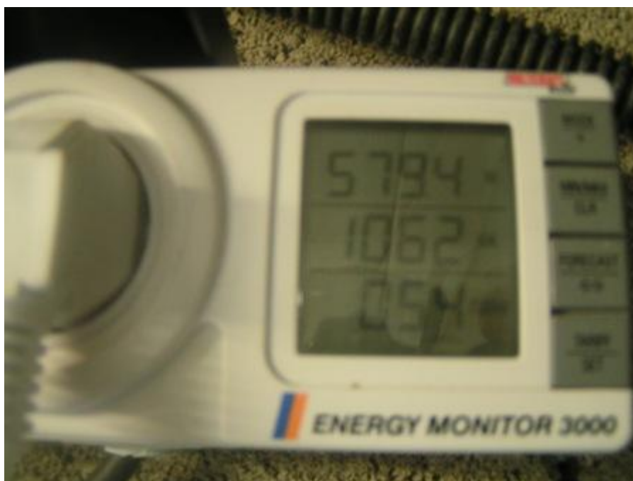
Figure 5 /moteur piscine 579 Watts /1062 VA / cos 0.54