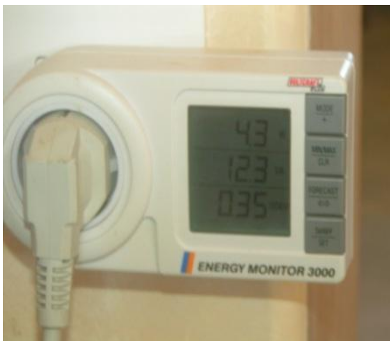
Figure 6 ordi en veille 4.3 Watts // 12.3 VA cos 0.35 soit 8 va d'énergie rajoutée.