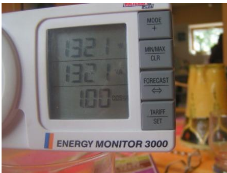
Figure 4 four cuisine 1320 W = 1320 VA puisque cos =1