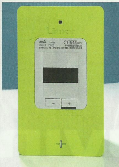
Les ondes injectées par Linky dans les câbles électriques ont une fréquence plus de 1 000 fois supérieure au courant (50 Hz).

Quelques lignes plus loin, le courrier reprend : « Le compteur Linky utilise une bande de fréquence spécifique (CENELEC A) réservée à ERDF afin d'éviter toute interférence avec d'autres équipements. » Mais de quelles fréquences s'agit-il ?